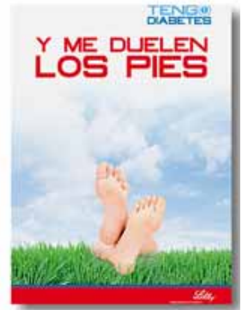
Díptico de la campaña.

La prevención de la neuropatía es uno de los mayores retos para los profesionales sanitarios que manejan estos pacientes. En principio, señala, “un paciente bien controlado de la diabetes evita en gran medida que esta complicación aparezca”. Por ello, explica, “el principal consejo sobre el que debe insistir el farmacéutico es en el seguimiento correcto del tratamiento, evitar su abandono o que se infradosifique el medica-