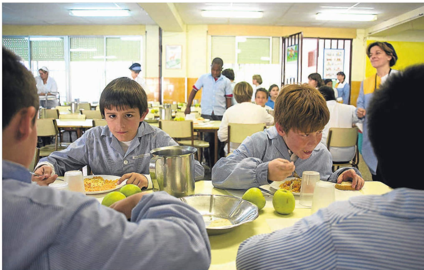
LAS COMIDAS QUE SE HACEN EN LA ESCUELA FORMAN PARTE DE LA EDUCACIÓN PARA UNA BUENA ALIMENTACIÓN DE LOS NIÑOS ASPB