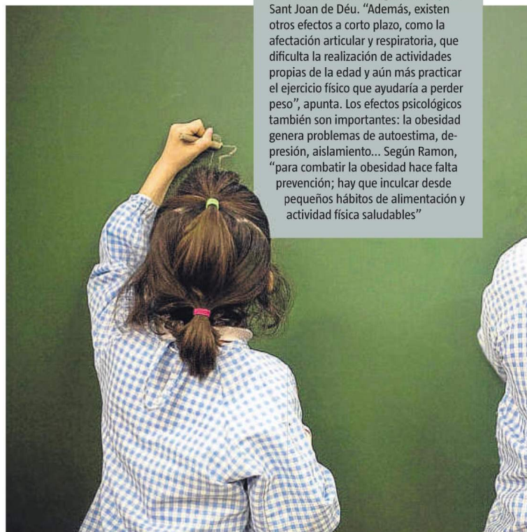
LA OBESIDAD INFANTIL PUEDE GENERAR COMPLEJOS Y AISLAMIENTO SOCIAL