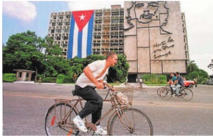
La escasez de los 90 limitó el uso del transporte público en Cuba

Este trabajo es «casi único», ya que se trata de un escenario «imposible de replicar en un ensayo clínico». Porque muestra los efectos a largo plazo de una