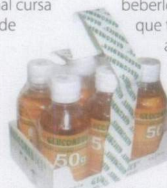
Pregunta si debes llevar tú la glucosa antes de hacerte la prueba.

Como la diabetes gestacional cursa sin síntomas, los resultados de esta prueba son los únicos datos con los que cuenta el médico para confirmar su presencia. Sin embargo, hay factores previos de riesgo: tener antecedentes familiares de diabetes, ser mayor de 35 años, tener sobrepeso y haber sido diagnosticada de diabetes gestacional en un embarazo anterior.