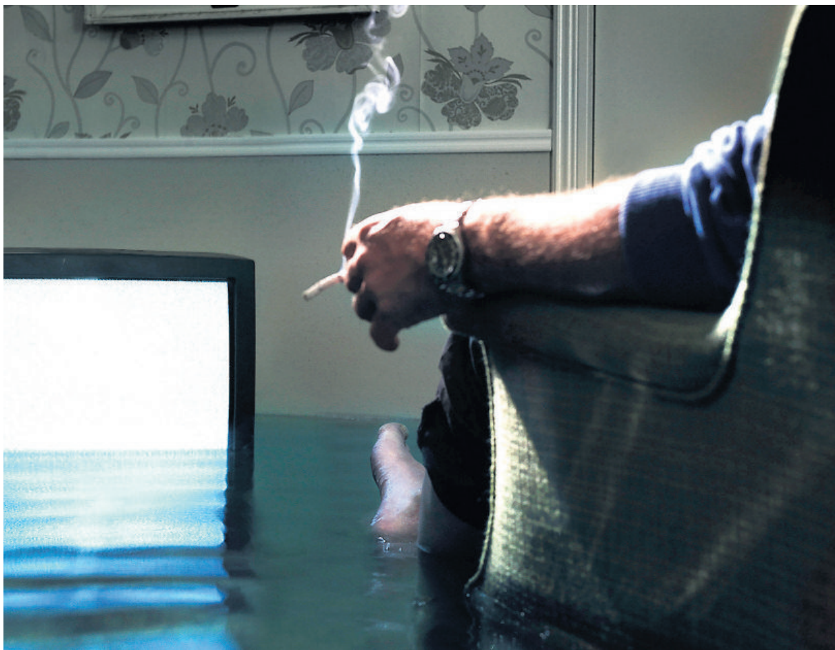
El sedentarismo es el cuarto factor de riesgo de la mortalidad mundial.