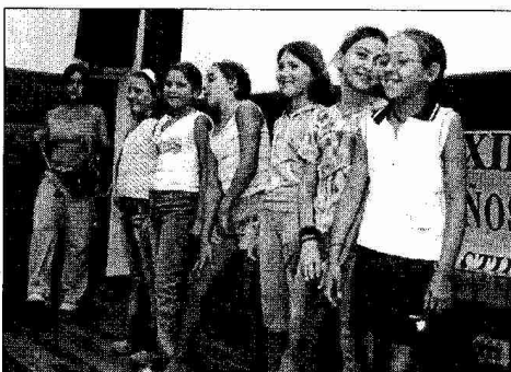
Fútbol, halconman, voleibol y unihockey han sido los deportes.