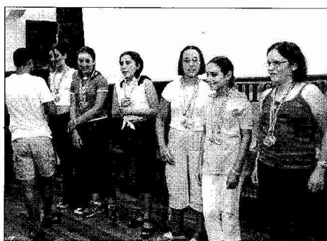
Los monitores han sido los encargados de repartir las medallas.