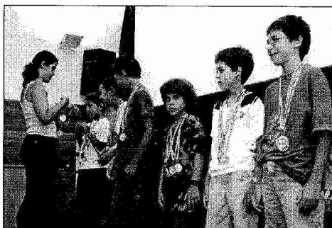
El deporte ha sido lo mejor del campamento para muchos niños.