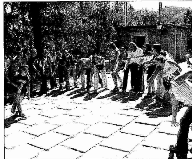
Chicos y monitores se han despedido en las puertas del castillo con un baile.

La entrega de premios ha sido uno de los momentos más emotivos.