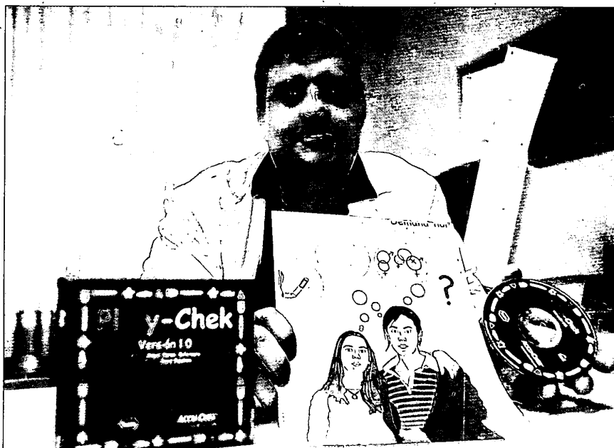
Flores también ha diseñado los dibujos e ilustraciones de su juego interactivo sobre diabetes para niños.

El enfermero trabaja ya en una nueva versión dedicada a los adolescentes