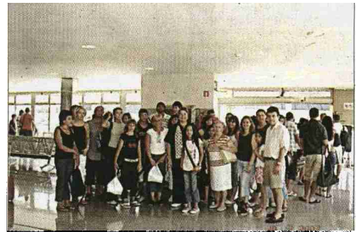
El segundo grupo viajó hasta Tarragona.

Hospital de Son Dureta. El objetivo principal de los campamentos es conseguir que los niños/as y jóvenes con diabetes se diviertan y disfruten de unas vacaciones, pero que, al mismo tiempo, aprendan los conocimientos básicos y necesarios para saber controlar la diabetes y poder llevar una vida completamente normalizada. Por eso, además de realizar juegos y actividades lúdicas,