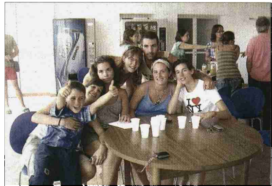
Las dos colonias resultaron todo un éxito.

se impartieron charlas sobre la diabetes, la insulina, saber reconocer las hipoglucemias, etc. Y se aprendió a comer sano y distin-