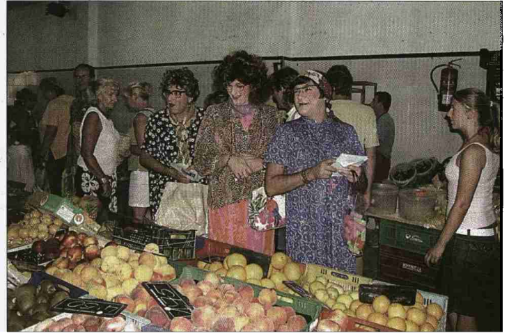
El trio hizo gala de su humor y bromeó con clientes de las peluquerías. También entraron en el mercado del pueblo e hicieron reír a todo aquel que se les cruzó en el camino.