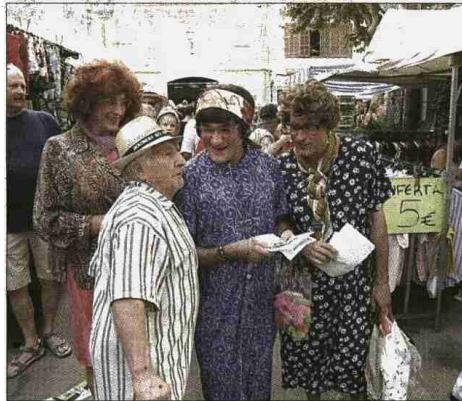
Hablaron y rieron con los vecinos de la localidad.