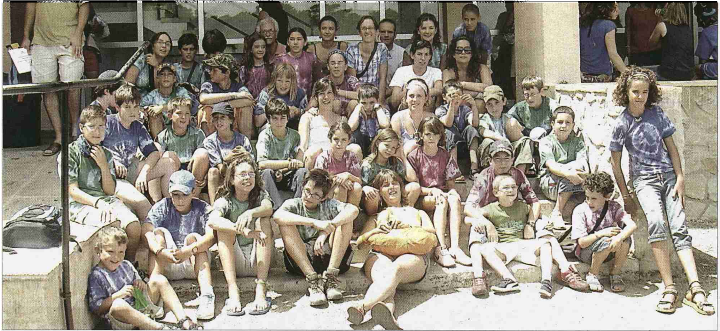
Numeroso grupo de jóvenes que participaron en estas interesantes colonias educativas, donde el juego y la enseñanza se han dado la mano.