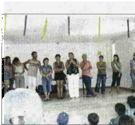
También se impartieron charlas.

El objetivo es conseguir que los niños aprendan cómo controlar la enfermedad y lleven una vida completamente normal