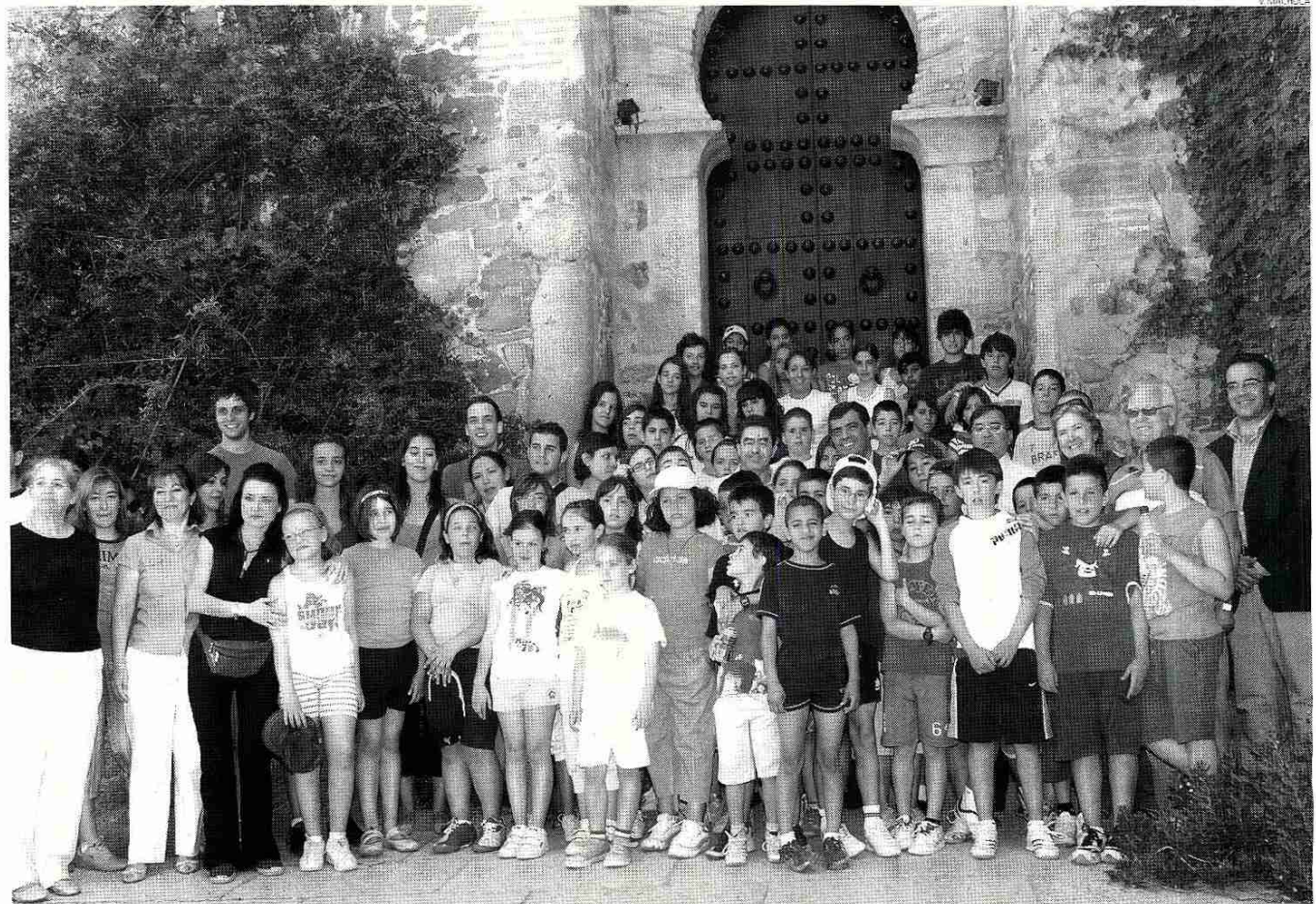
Junto a los políticos, chicos y chicas, monitores, médicos, enfermeros y demás colaboradores posaron en la tradicional foto de familia del campamento:

SANIDAD Visita del consejero de Sanidad al campamento organizado por la Asociación de Diabéticos de Toledo