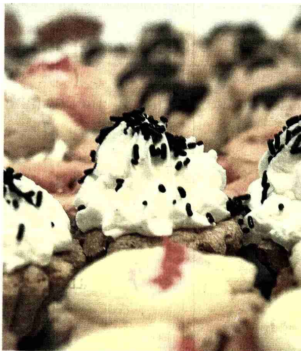
Se recomienda a los diabéticos prescindir de la repostería. HERALDO

La enfermera alega que en estos chequeos se presta especial atención a la vista, los pies y los riñones, ya que la diabetes daña los vasos de la retina y afecta al sistema nervioso y vascular. Así, las