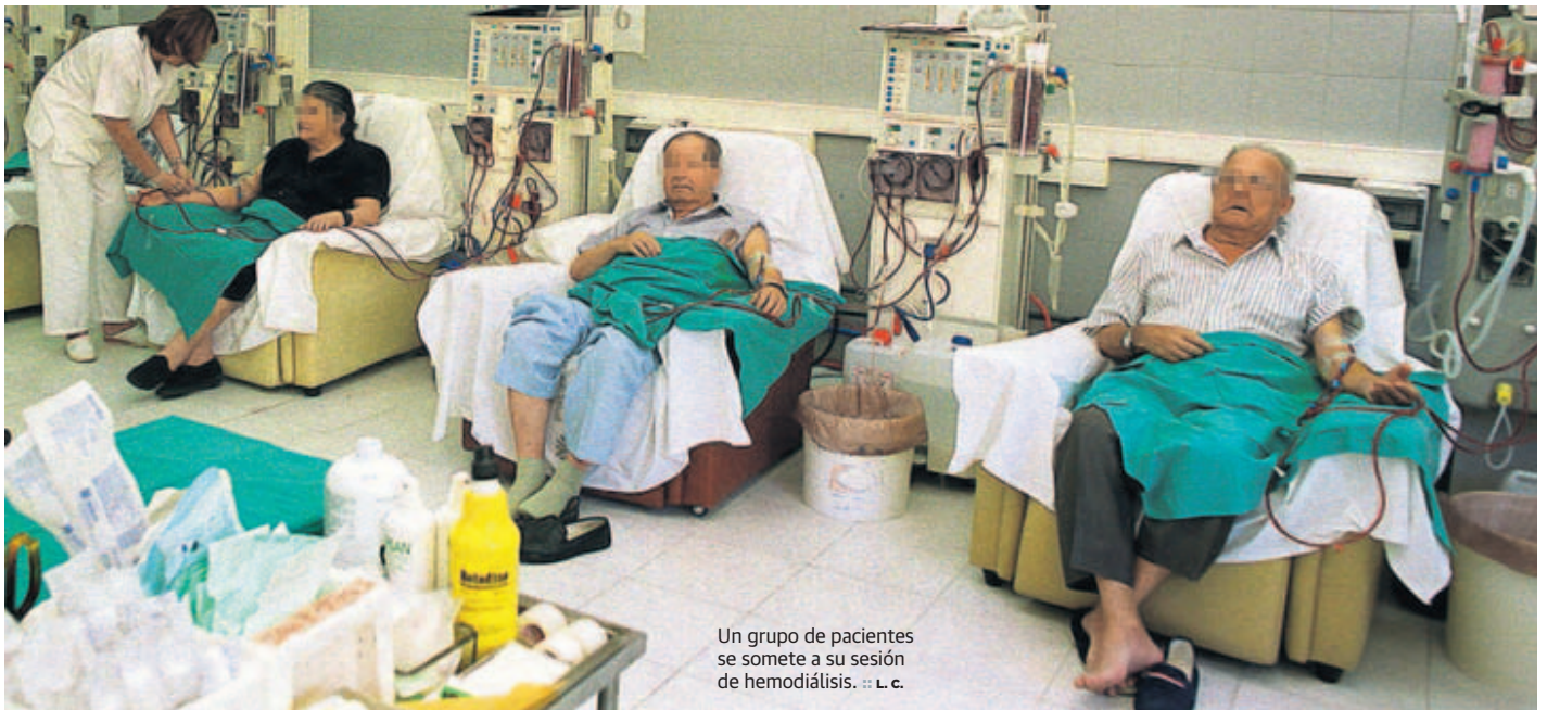
Un grupo de pacientes se somete a su sesión de hemodiálisis. :: L. c.